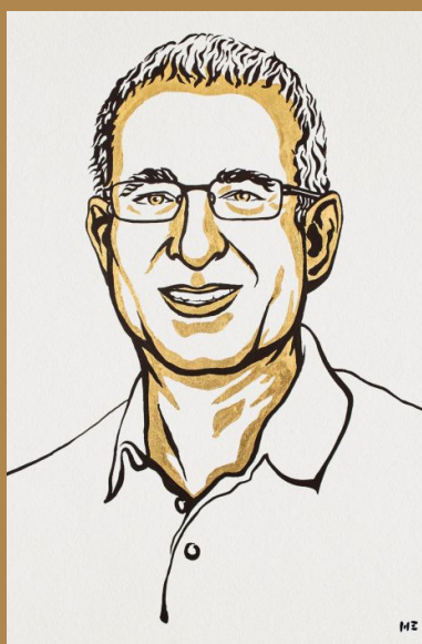
Joshua D. Angrist